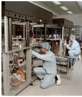
KMWE in bedrijf